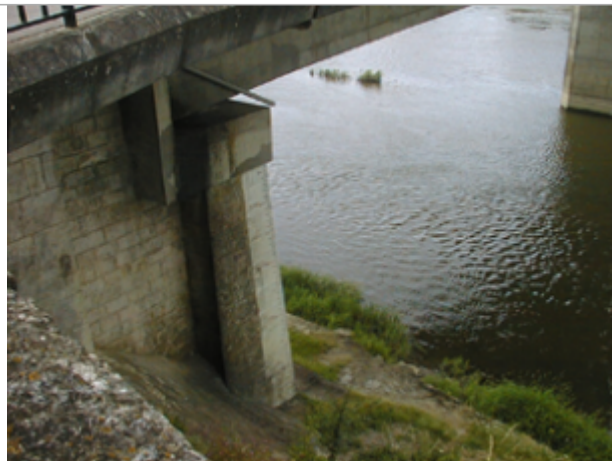
Vue du site BDHE 2123 point de repère 2370