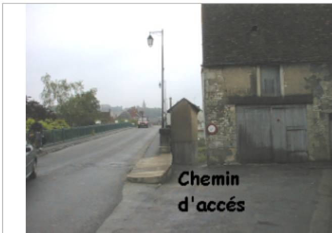
Vue du site BDHE 2040 point de repère 2162

Coordonnées WGS84 : X: 2.31288464 / Y: 46.85703535