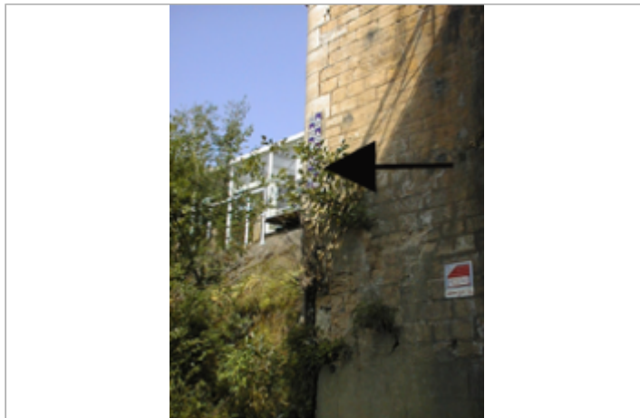
Vue du site BDHE 2027 point de repère 2087