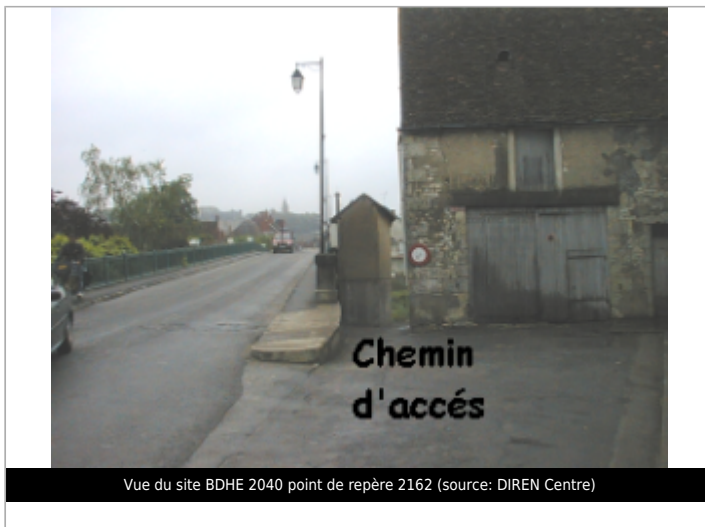
Vue du site BDHE 2040 point de repère 2162