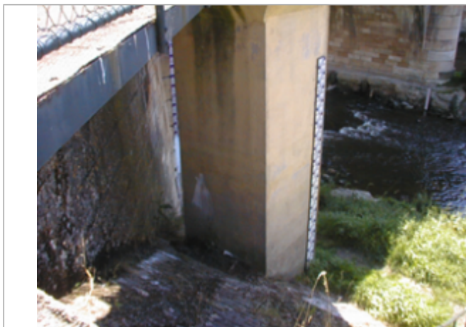
Vue du site BDHE 2030 point de repère 2091