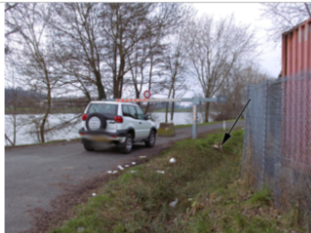
Vue du site BDHE 2174 point de repère 2445

Coordonnées WGS84 : X: 0.73853517 / Y: 47.37107228