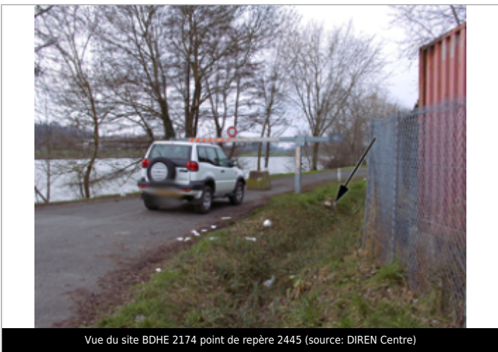
Vue du site BDHE 2174 point de repère 2445

GÉOLOCALISATION Coordonnées WGS84 : X: 0.73853517 / Y: 47.37107228 Coordonnées RGF93 (Lambert 93) X: 529363 / Y: 6699192 Coordonnées RGF93 (ETRS89) : X: 0.7385352 / Y: 47.3710723 Code Hydro: K---0090 Rive de référence: Droite