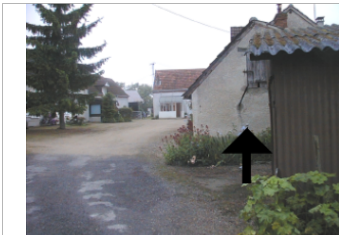
Vue du site BDHE 2061 point de repère 2202