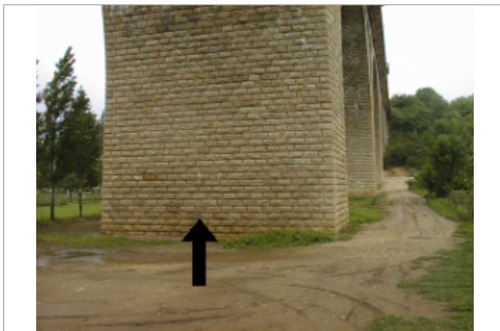
Vue du site BDHE 2046 point de repère 2171

GÉOLOCALISATION Coordonnées WGS84 : X: 2.24810938 / Y: 46.98645038 Coordonnées RGF93 (Lambert 93) X: 642853 / Y: 6654298 Coordonnées RGF93 (ETRS89) : X: 2.2481094 / Y: 46.9864504 Code Hydro: K---0090 Rive de référence: Droite