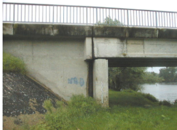
Vue du site BDHE 2043 point de repère 2166

Coordonnées WGS84 : X: 2.29647082 / Y: 46.92219758