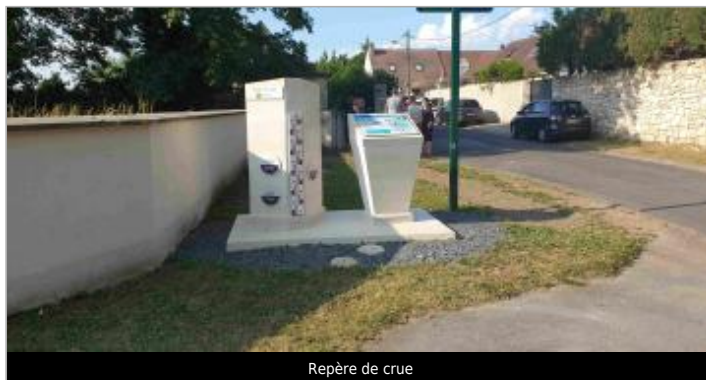
Repère de crue