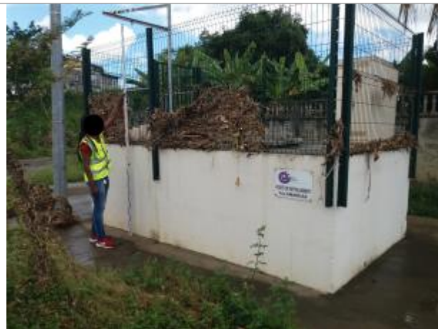
Poste de refoulement et dépôts sur grillage

Coordonnées RGF93 (ETRS89) : X: -61.490671 / Y: 16.28722