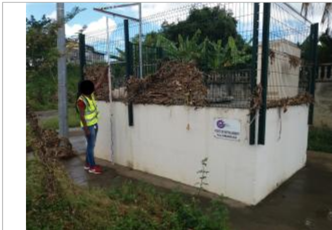
Poste de refoulement et dépôts sur grillage