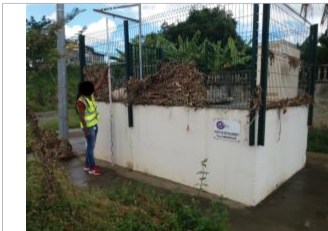
Poste de refoulement et dépôts sur grillage