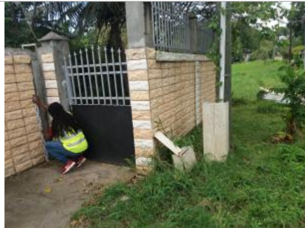
Mur de cloture à gauche du portillon d'entrée