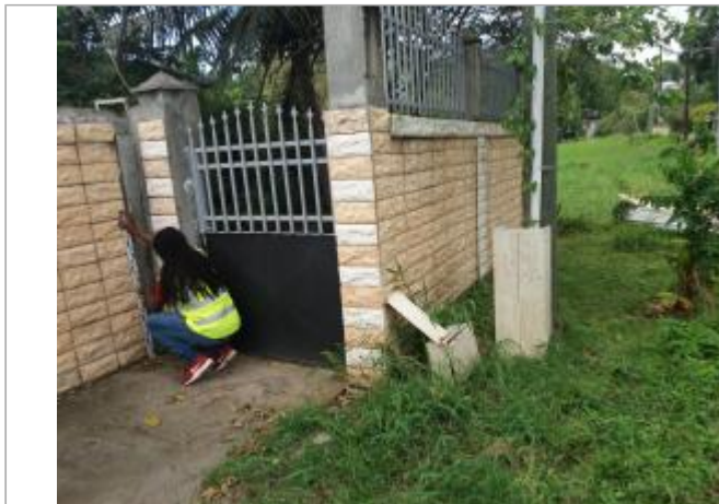
Mur de cloture à gauche du portillon d'entrée

Coordonnées WGS84 : X: -61.47785600 / Y: 16.28658400