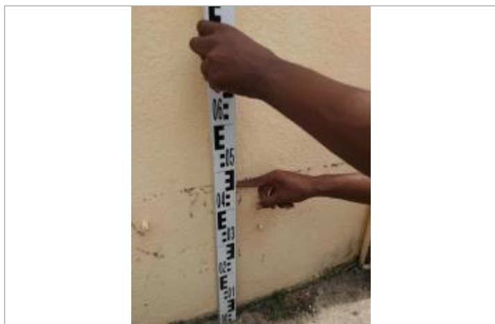
Niveau mesuré depuis la dalle béton

Altitude calculée de l'eau (en m) : 19.14 m