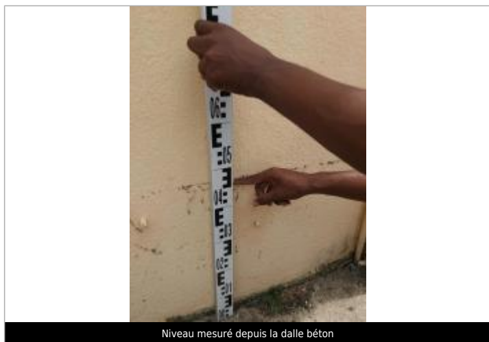
Niveau mesuré depuis la dalle béton

Altitude calculée de l'eau (en m) : 19.14