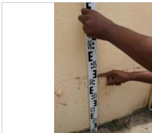
Niveau mesuré depuis la dalle béton

Altitude calculée de l'eau (en m) : 19.14