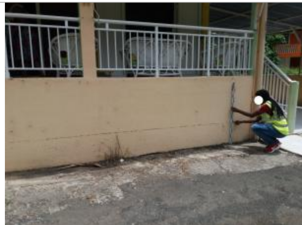
Route de chazeau au droit intersection route de pavé - Imp Reveillé

Coordonnées WGS84 : X: -61.46268900 / Y: 16.29281600