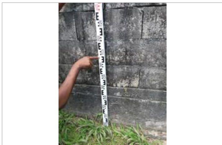
Niveau mesuré depuis le sol

Altitude calculée de l'eau (en m) : 19.99 m