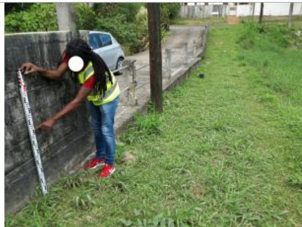
Route de chazeau au droit intersection route de pavé

Coordonnées WGS84 : X: -61.46256200 / Y: 16.29228600