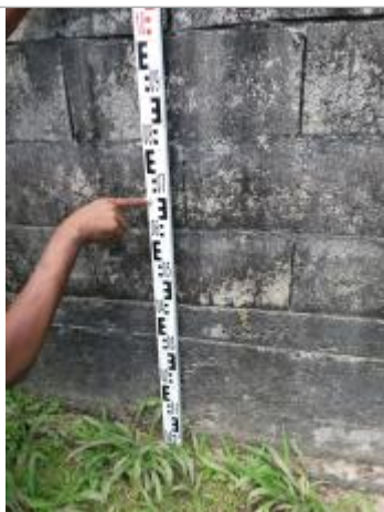
Niveau mesuré depuis le sol

Altitude calculée de l'eau (en m) : 19.99 m