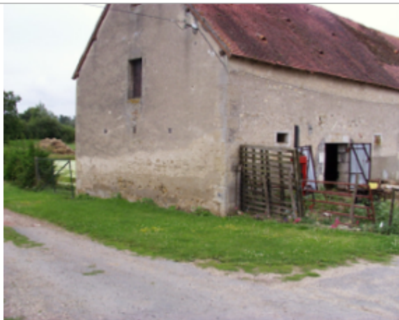
Vue du site BDHE 4152 point de repère 4267