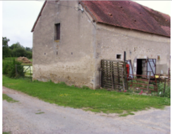
Vue du site BDHE 4152 point de repère 4267

Coordonnées WGS84 : X: 3.05385251 / Y: 46.84241649