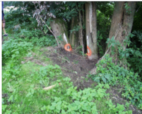
Vue du site BDHE 4033 point de repère 4077

Coordonnées WGS84 : X: 3.11937420 / Y: 46.73094321