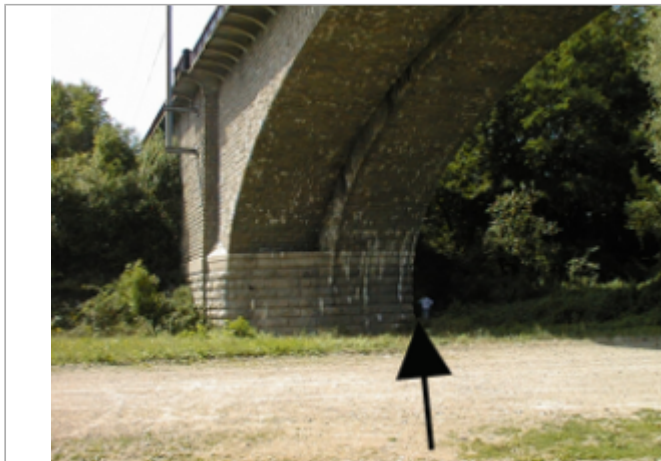
Vue du site BDHE 4130 point de repère 4232