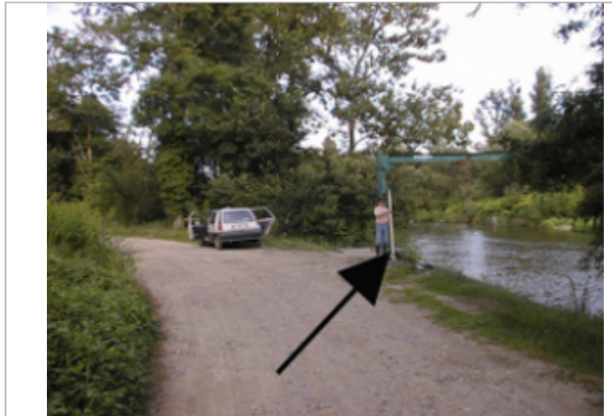
Vue du site BDHE 4122 point de repère 4216

Coordonnées WGS84 : X: 3.42229451 / Y: 45.95531468