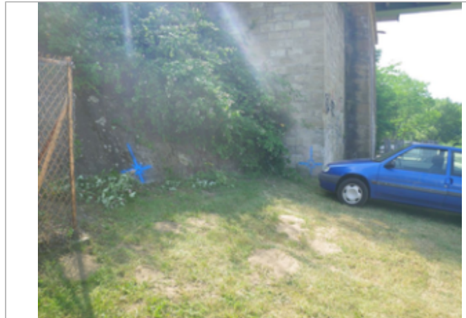
Vue du site BDHE 4100 point de repère 4176

Coordonnées WGS84 : X: 3.20851838 / Y: 45.66866204