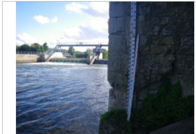
Vue du site BDHE 4065 point de repère 4097

Coordonnées WGS84 : X: 3.05060786 / Y: 46.92292918