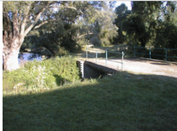
Vue du site BDHE 4047 point de repère 4095