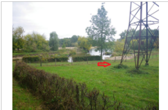
Vue du site BDHE 4038 point de repère 4047