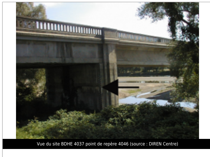
Vue du site BDHE 4037 point de repère 4046