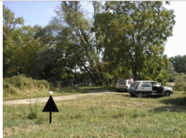
Vue du site BDHE 4034 point de repère 4043

Coordonnées WGS84 : X: 3.09446523 / Y: 46.73718822