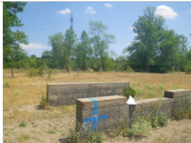
Vue du site BDHE 4028 point de repère 4070