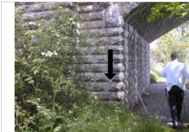
Vue du site BDHE 4012 point de repère 4021

Coordonnées WGS84 : X: 3.34792249 / Y: 46.35082126