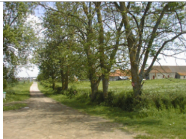
Vue du site BDHE 4010 point de repère 4016