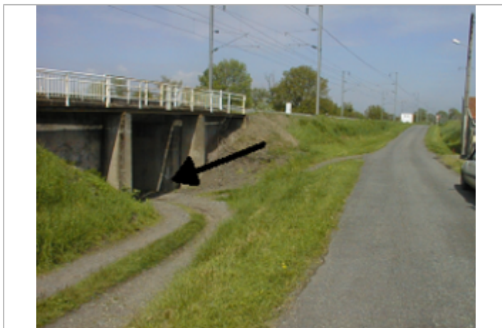
Vue du site BDHE 4004 point de repère 4006