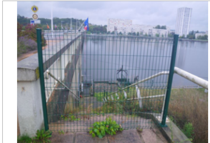
Vue du site BDHE 4001 point de repère 4003

Coordonnées WGS84 : X: 3.40955605 / Y: 46.14168452