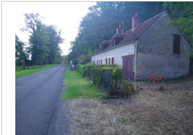
Vue du site BDHE 4049 point de repère 4055