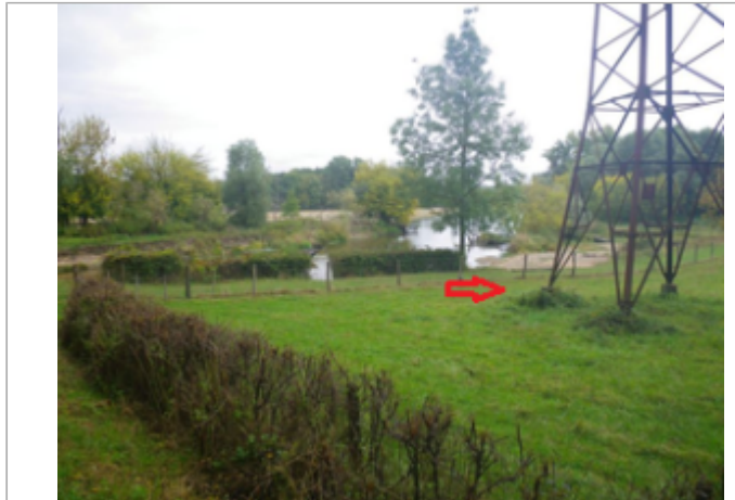
Vue du site BDHE 4038 point de repère 4047

Coordonnées WGS84 : X: 3.03370782 / Y: 46.77514704