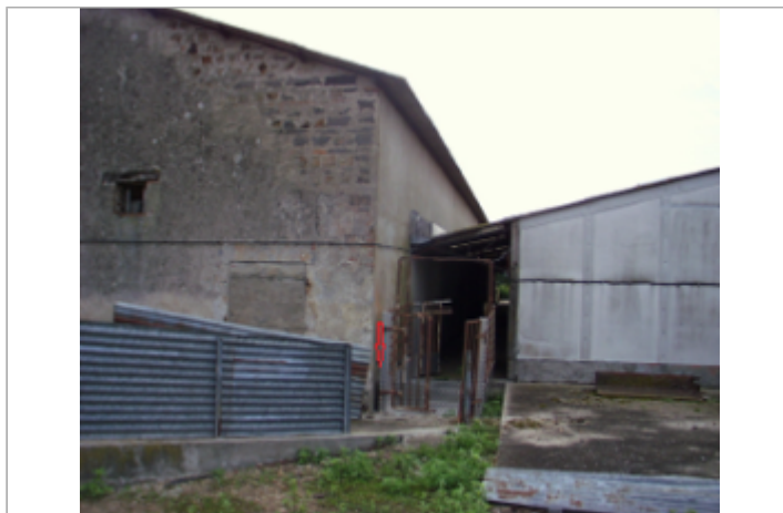
Vue du site BDHE 4145 point de repère 4247