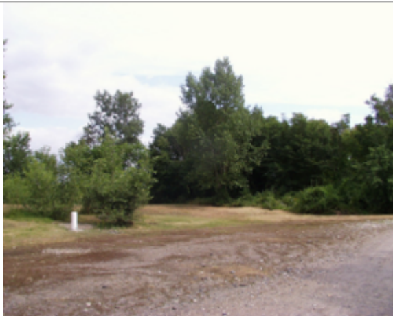
Vue du site BDHE 4143 point de repère 4272