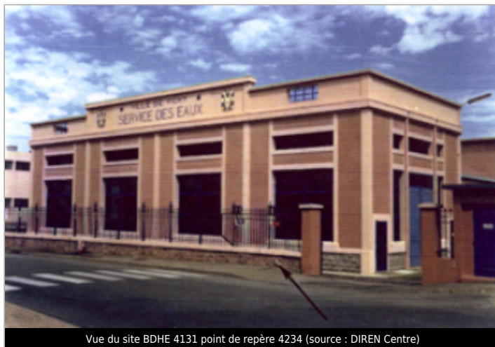
Vue du site BDHE 4131 point de repère 4234