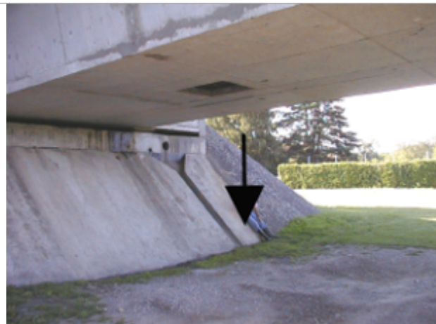
Vue du site BDHE 4115 point de repère 4205

Coordonnées WGS84 : X: 3.30595493 / Y: 45.86217201