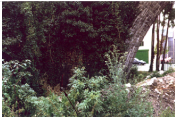
Vue du site BDHE 4110 point de repère 4195

Coordonnées WGS84 : X: 3.24343889 / Y: 45.78801509