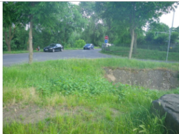
Vue du site BDHE 4106 point de repère 4187