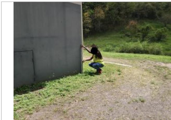
Angle bâtiment façade extérieure