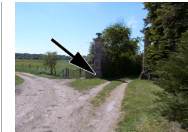
Vue du site BDHE 4043 point de repère 4087