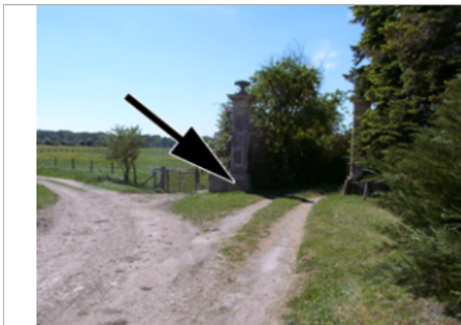
Vue du site BDHE 4043 point de repère 4087

Coordonnées WGS84 : X: 3.05655378 / Y: 46.84064145