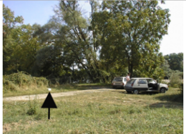
Vue du site BDHE 4034 point de repère 4043

Coordonnées WGS84 : X: 3.09446523 / Y: 46.73718822