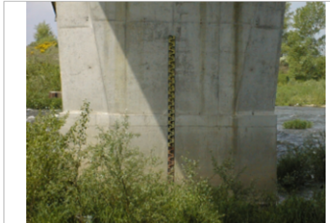
Vue du site BDHE 4023 point de repère 4008

Coordonnées WGS84 : X: 3.41929836 / Y: 46.19261718