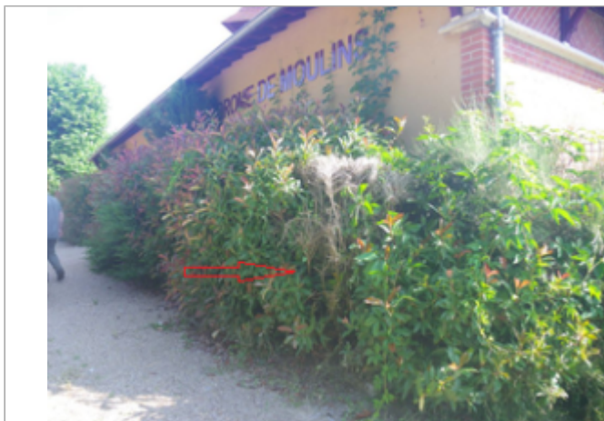
Vue du site BDHE 4021 point de repère 4035