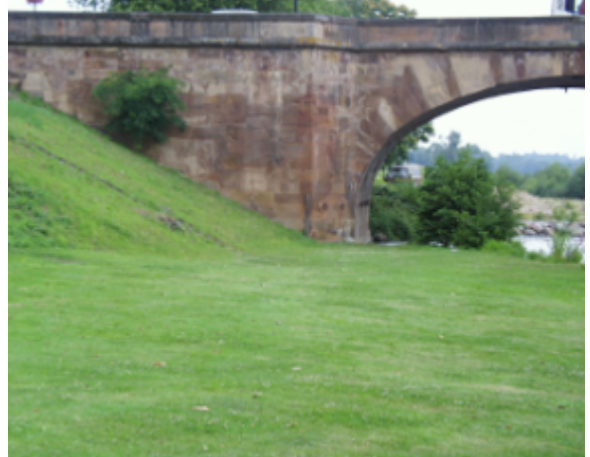
Vue du site BDHE 4020 point de repère 4033

Coordonnées WGS84 : X: 3.32131569 / Y: 46.56096841