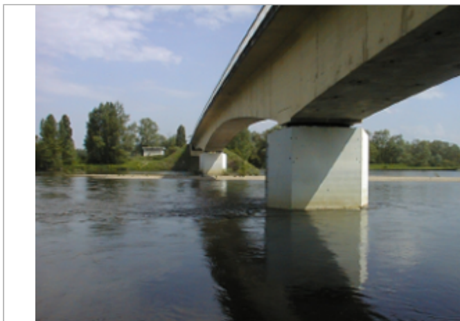
Vue du site BDHE 4014 point de repère 4025