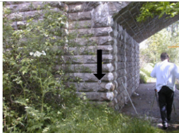
Vue du site BDHE 4012 point de repère 4021

Coordonnées WGS84 : X: 3.34792249 / Y: 46.35082126