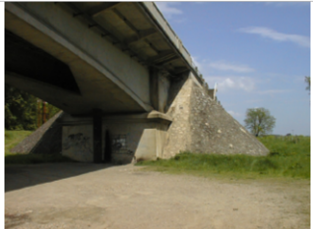
Vue du site BDHE 4011 point de repère 4017

Coordonnées WGS84 : X: 3.36401219 / Y: 46.32206371