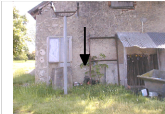
Vue du site BDHE 4009 point de repère 4014